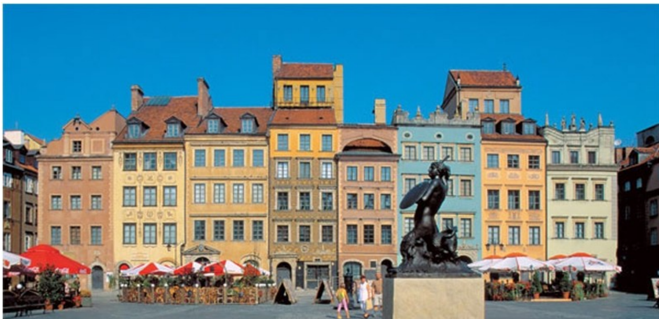
Den lilla sjöjungfrun – Syrenka - på Gamla stadens torg.